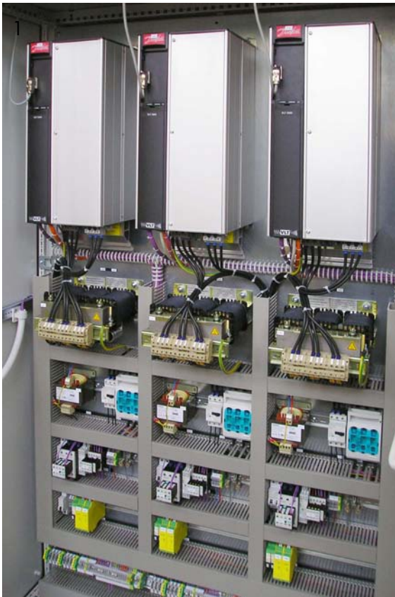
Abb. 1: 15 kW Danfoss-Frequenzumrichter mit Sinusfilter