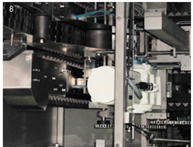
Abb. 8: Danfoss Bauer Aseptic Motor Lüfterseitig betrachtet