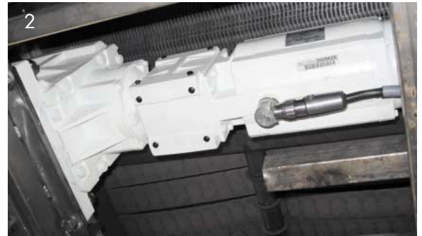
Abb. 2: Danfoss Bauer Aseptic Motor unter einem Plattenband