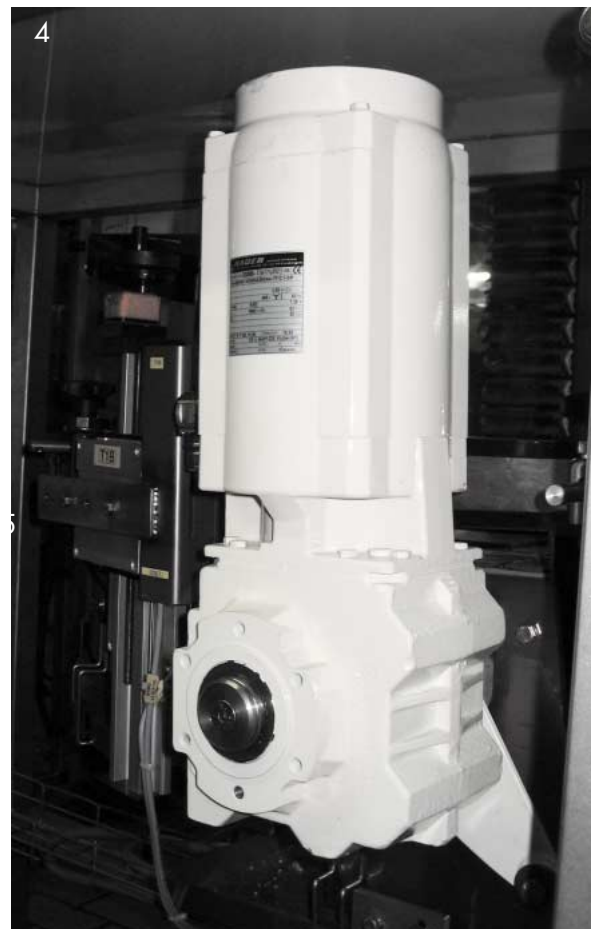
Abb. 4: Danfoss Bauer Aseptic Motor hochkant am Transporteur