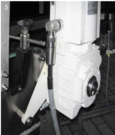
Abb. 5: Danfoss Bauer Aseptic Motor mit Drehmomentenstütze und Aseptic Stecker