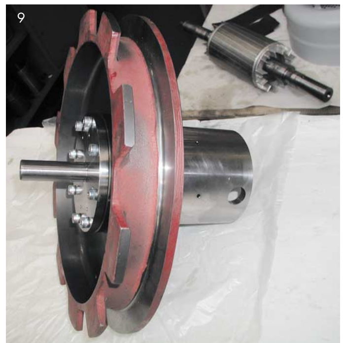
Abb. 9: Erneuerung der Führungsnarbe mit der Verstellplatte