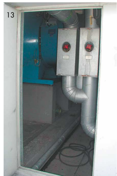
Abb. 12-13: Probelauf des montierten Lüfters