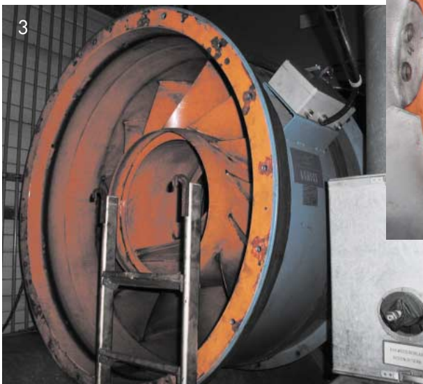
Abb. 3: Lüftergehäuse nach Demontage des Flügelrads