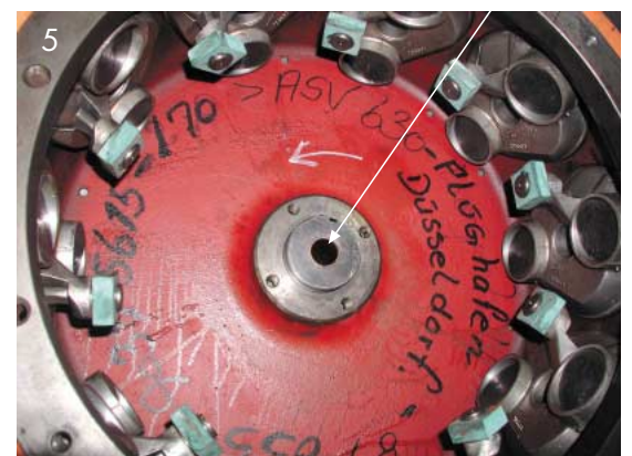
Abb. 5: Führungsbronzelager für Verstellereinheit