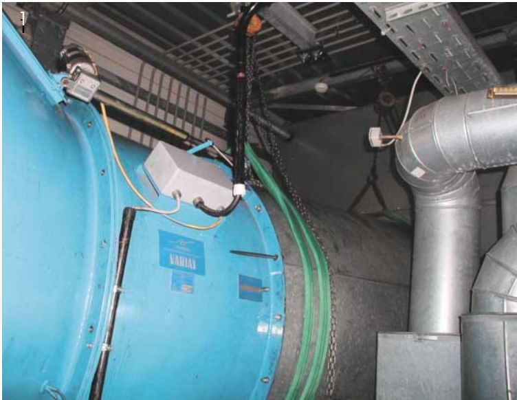
Abb. 1: Verstellereinheit im Luftansaugkanal