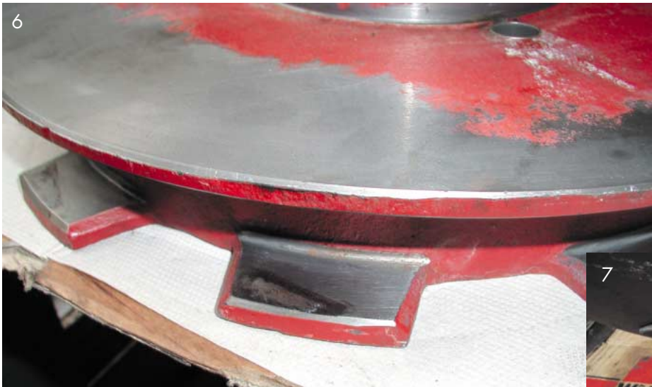
Abb. 6: Verstellplattenverschleiß am Kulissensitz