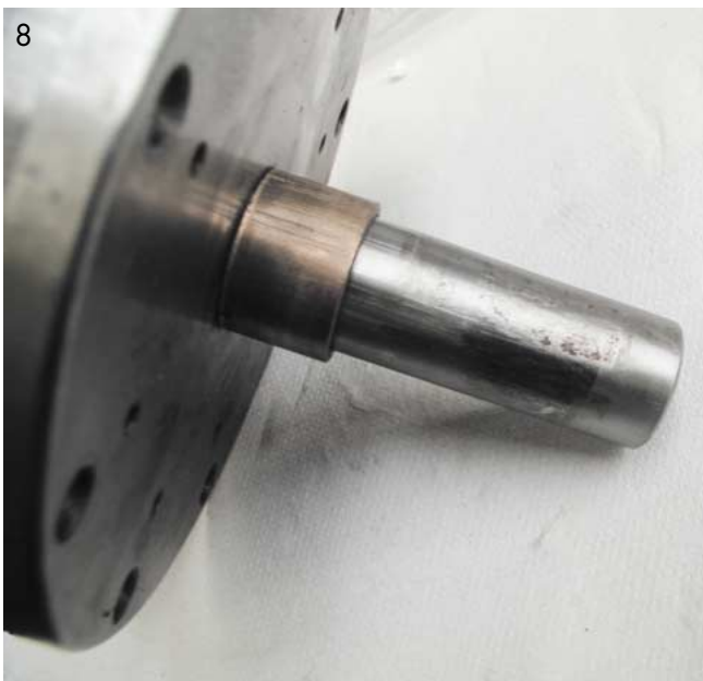
Abb. 8: Führungsnarben Verschleiß