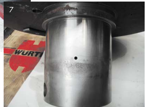
Abb. 7: Verstellplattenverschleiß an der Führungshülse