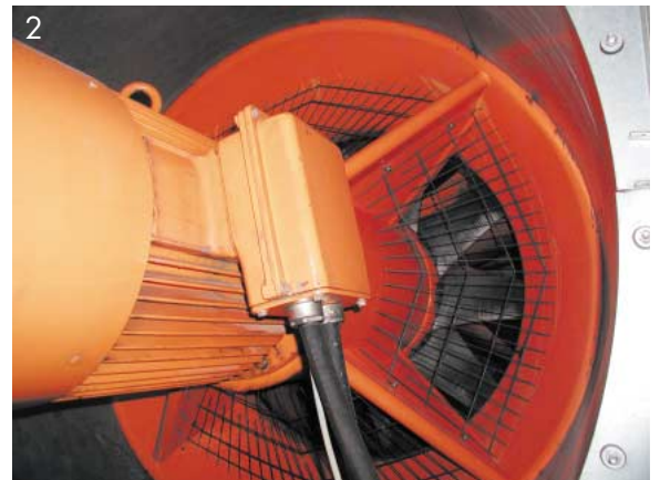
Abb. 2: Lüfterantrieb